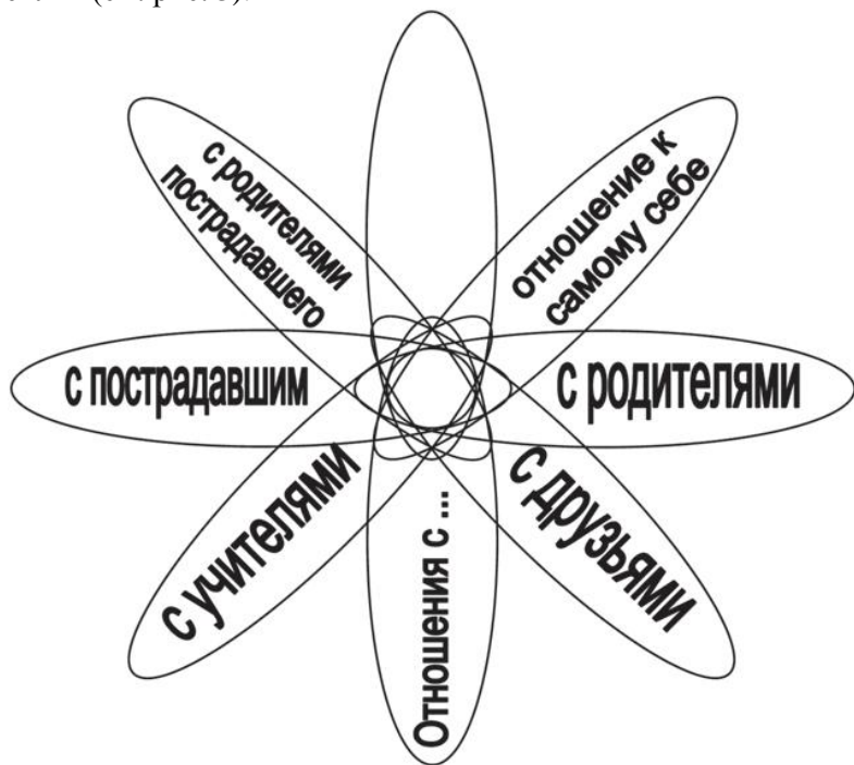
Рис. 3. Ромашка будущего – желаемые отношения

ет видеть в своей истории события, на которые раньше не обращал внимания. Ради такого будущего он готов прикладывать усилия (см. рис. 3).