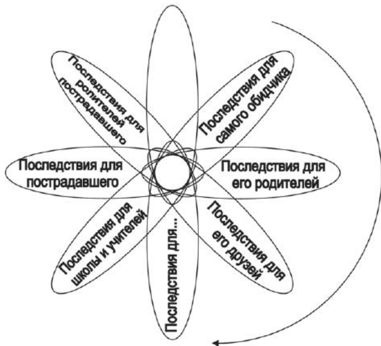
Рис .2. Ромашка последствий

нейших является принятие сторонами конфликта ответственности за исправление негативных последствий. Эту тему нельзя игнорировать. Тем более что она касается одной из важнейших ценностей: воспитания и дальнейшей судьбы несовершеннолетнего правонарушителя. Поэтому медиатор поднимает вопрос ответственности, даже если участники «обошли его стороной».